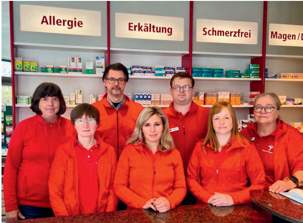
Foto: Das Team der Viktoria-Apotheke ist für die Kunden vor Ort.

Zum Sortiment gehören zudem pflegende Kosmetika und apothekenexklusive medizinische Hautpflegeprodukte. „Zusammen finden wir die richtigen Produkte für den Einzelfall heraus“, ist sich die Chefin sicher.